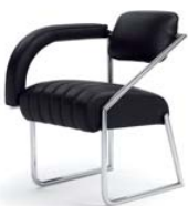
NON CONFORMIST 1926