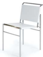
Leder weiß leather white