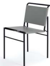
Leder grau leather grey