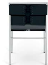
Leder schwarz leather black

Estructura de tubos de acero cromado o pulverizado. Asiento y respaldo de cuero ceñido. Detalles y colores ver lista de precios.