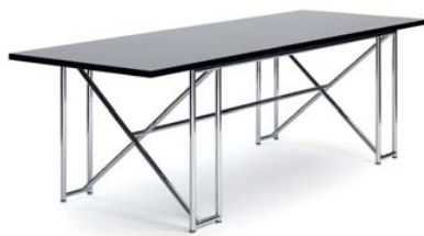
DOUBLE X 1928