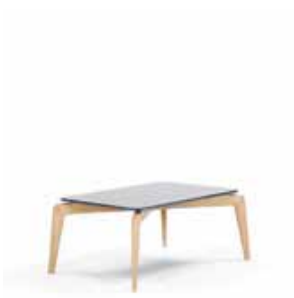
MUNICH COFFEE TABLE 2010