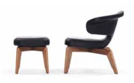
Munich Stool | Munich Lounge Chair

Estructura de madera. Acolchado de poliuretano con poliéster. Tapicería de tela o piel. Detalles, colores y normas europeas probado ver lista de precios.