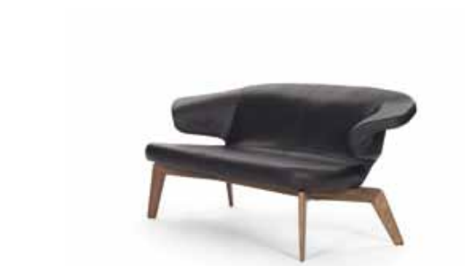
MUNICH SOFA 2010