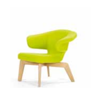
MUNICH LOUNGE CHAIR 2009