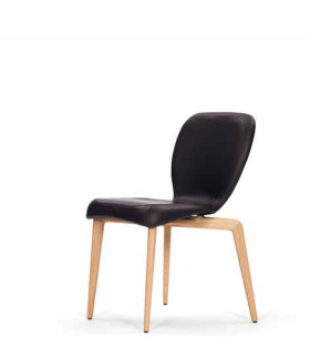
MUNICH CHAIR 2009