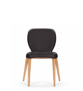
MUNICH CHAIR 2009