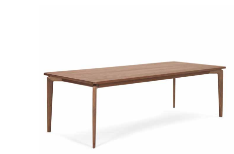
MUNICH TABLE 2011