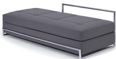
DAY BED 1925