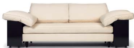
Manila natur nature

Marco de madera de haya acolchado y con muelles. Cojines sueltos con relleno de plumas naturales. Cojines traseros y laterales sueltos rellenos de plumas naturales y estabilizadores. Cajas laterales de MDF con ruedas, lacado en brillo intenso. Parte delantera y trasera siempre negra. Tapicería de tela o cuero. Detalles y colores ver lista de precios.