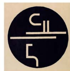
ST. TROPEZ 1925 - 1935