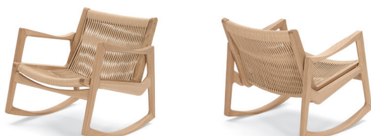
Eiche natur, Kordel hanffarben Oak, cord hemp-coloured

Estructura de madera maciza, con lacado transparente o barniz oscuro. A elección, malla de cordel o con acolchado de poliuretano con cintas de goma y tapicería de tela o piel. Para más detalles, colores y normas europeas, ver lista de precios.