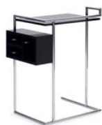
PETITE COIFFEUSE 1929