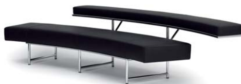
MONTE CARLO 1929