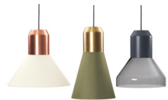
BELL LIGHT PENDANT LAMP 2013