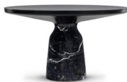
BELL DINING TABLE 2025