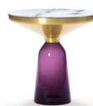
BELL SIDE TABLE